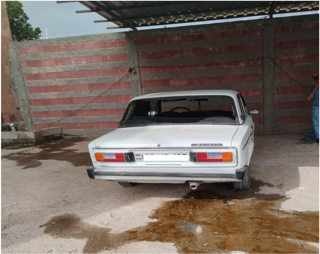
Լուսանկար 5. Կրակոցների հետևանքով վնասված քաղաքացիական ավտոմեքենան: